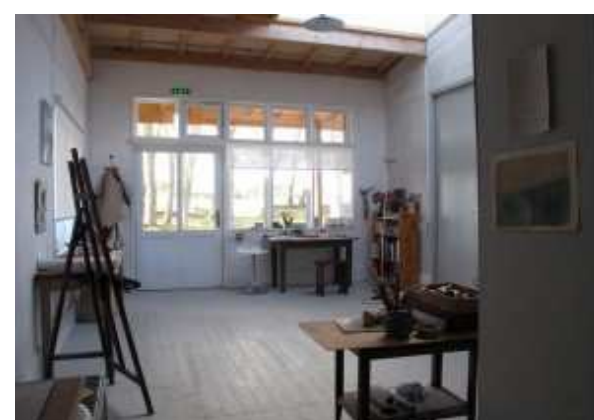
Les ateliers de création

Plus d'informations et d'images sur www.domainedutournefou.com