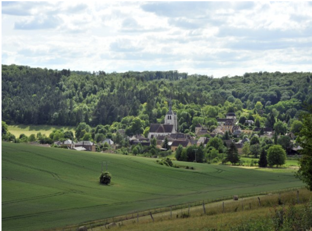
Vue du village de Pâlis dans l'Aube

Un certain niveau d'autonomie et d'autosuffisance est attendu, mais surtout, n'hésitez pas à solliciter notre aide pour tout imprévu, nous y répondrons dans la mesure de nos possibilités. Durant tout votre séjour, il y aura constamment quelqu'un de l'association présent sur le Domaine, n'hésitez pas à l'appeler si nécessaire.