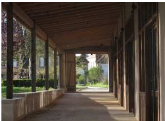
La Ruelle des ateliers