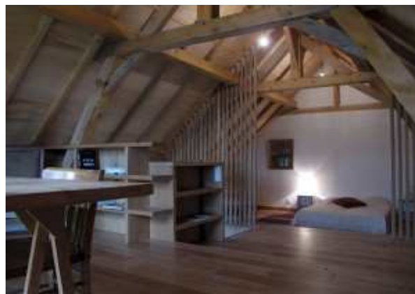
Studio d'hébergement et d'écriture