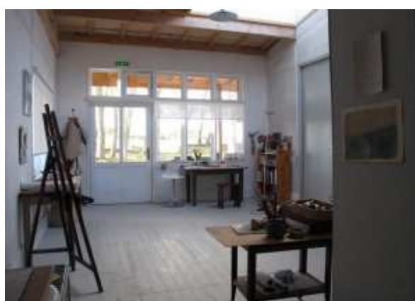
Les ateliers de création

Plus d'informations et de photos des résidences sur https://www.domainedutournefou.com/residences-dartistes/